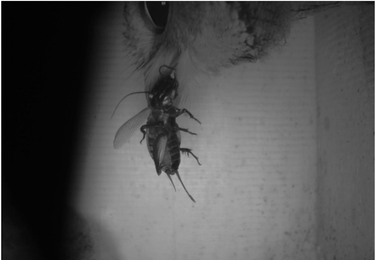
Slika 5: Veliki skovik s plenom za mladiče - poljskim murnom.