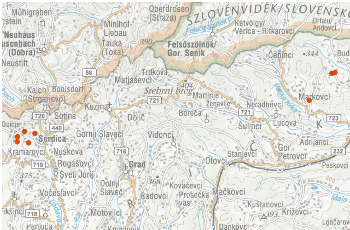
Slika 3: Lokacije najdenih gnezd velikega skovika na Goričkem v letu 2013.