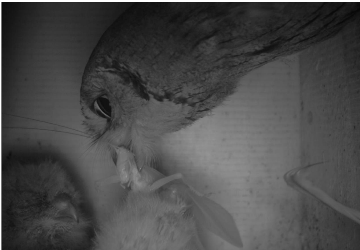
Slika 4: Veliki skovik s plenom za mladiče - kobilico.