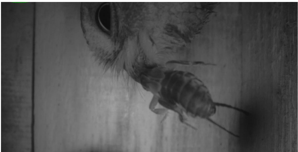
Slika 6: Veliki skovik s plenom za mladiče - bramorjem.