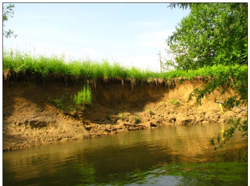
Slika 12.4. Reka Voglajna predstavlja v osrednjem delu velik potencial za gnezditvene stene vodomca.