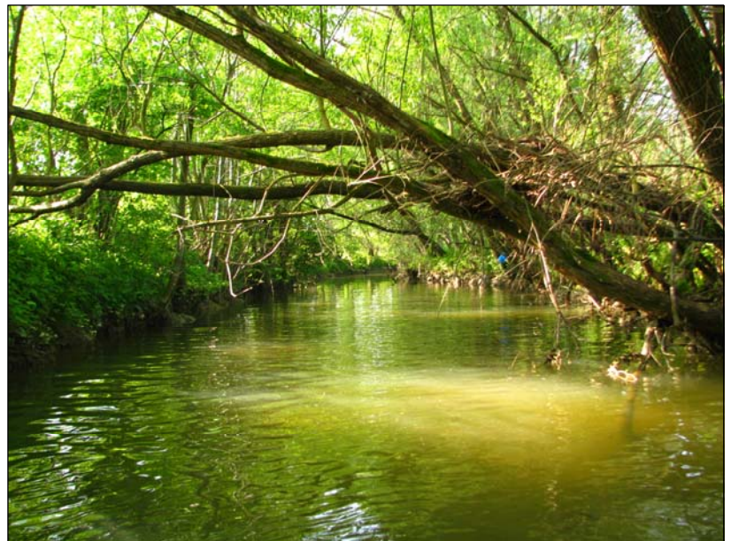
Slika 12.3. V osrednjem delu reke Voglajne je za vodomca ( Alcedo atthis ) zadostno število lovnih prež.