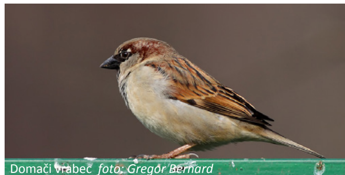
Domači vrabec

V enem tednu akcije smo skupaj prešteli več kot 5.500 ptic, ki so pripadale 43 vrstam. Tri najštevilčnejše vrste so bile domači vrabec ( Passer domesticus ), domači golob ( Columba livia domestica ) in siva vrana ( Corvus cornix ). Med zanimivejšimi in redkejšimi vrstami so izstopali srednji detel ( Dendrocopos medius ), kalin ( Pyrrhula pyrrhula ), siva pevka ( Prunella modularis ) in povodni kos ( Cinclus cinclus ).