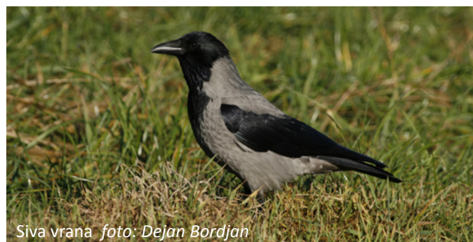
Siva vrana