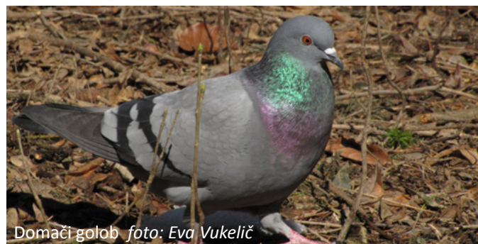
Domači golob