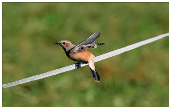
Slike 7–12 / Figures 7–12: (7) veliki prodnik Calidris canutus, 3. 10. 2015, Fontanigge, Sečoveljske soline ; (8) triprsti galeb Rissa tridactyla, 16. 10. 2015, Ptujsko jezero ; (9) zlatovranka Coracias garrulus, 1. 6. 2015, Kuk, Movraž ; (10) rjavoglavi srakoper Lanius senator, 2. 4. 2015, Fontanigge, Sečoveljske soline ; (11) rožnati škorec Pastor roseus, 1. 6. 2015, Dragomer ; (12) puščavski kupčar Oenanthe deserti, 4. 11. 2015, Pirče–Vas, Kostel