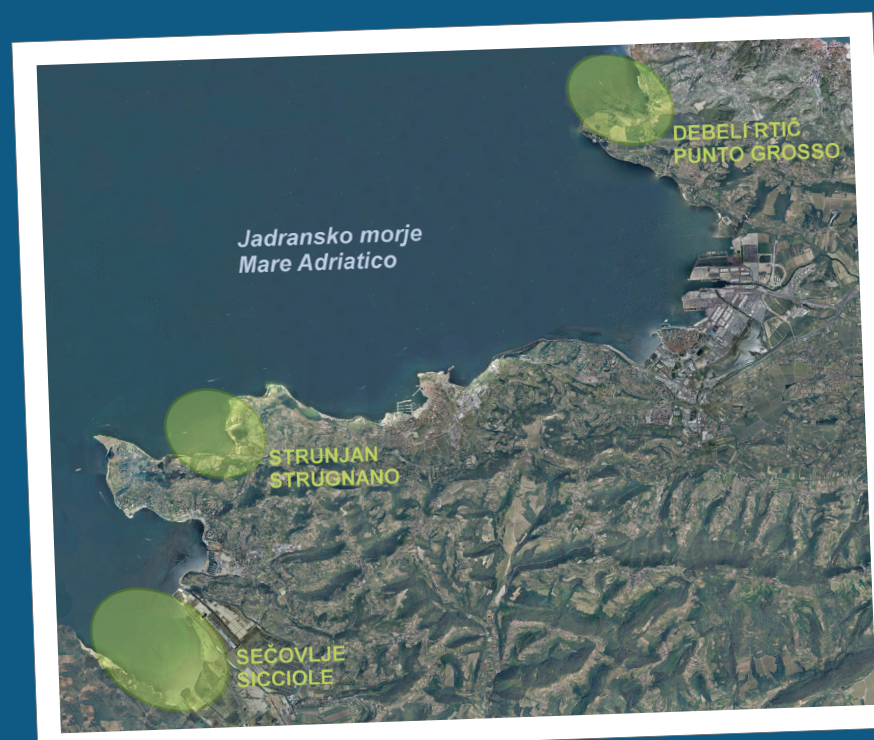
Zemljevid 1: Štetje vranjekov na skupinskih prenočiščih prispeva k natančni oceni njihove številčnosti.