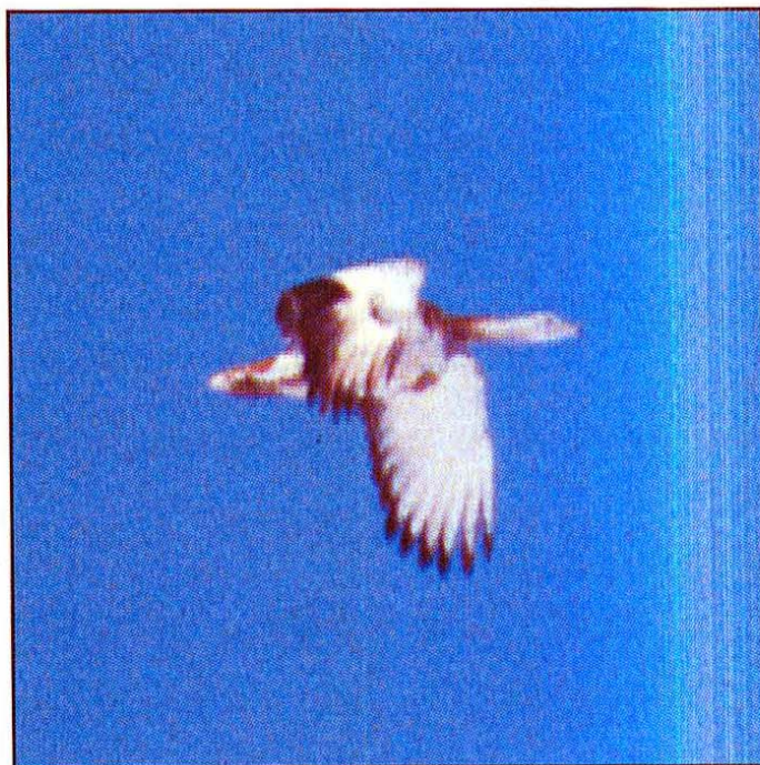
Velika droplja Great Bustard Otis tarda, 24. 2. 1996, Dane

30. Ovratničarka - Chlamydotis undulata / (1,1);(0,0)/