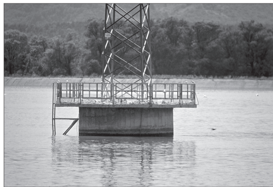
Slika 1: Betonski daljnovodni podstavek na Ptujskem jezeru, kjer je bila leta 2004 kolonija navadnih čiger Sterna hirundo

Ptujsko akumulacijsko jezero je nastalo z zajezitvijo reke Drave v Markovcih pri Ptujju. Zgrajeno je bilo za potrebe delovanja pretočne kanalske hidroelektrarne Formin, ki je začela obratovati leta 1978 (ŠMON 2000). Površina jezera je 4,2 km 2 . Nasipi jezera so umetni. Območje sodi v subpanonsko zoogeografsko regijo Slovenije (MRŠIČ 1997) in je del posebnega