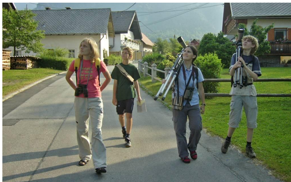
Slika 2: Popisovanje ptic v Begunjah.