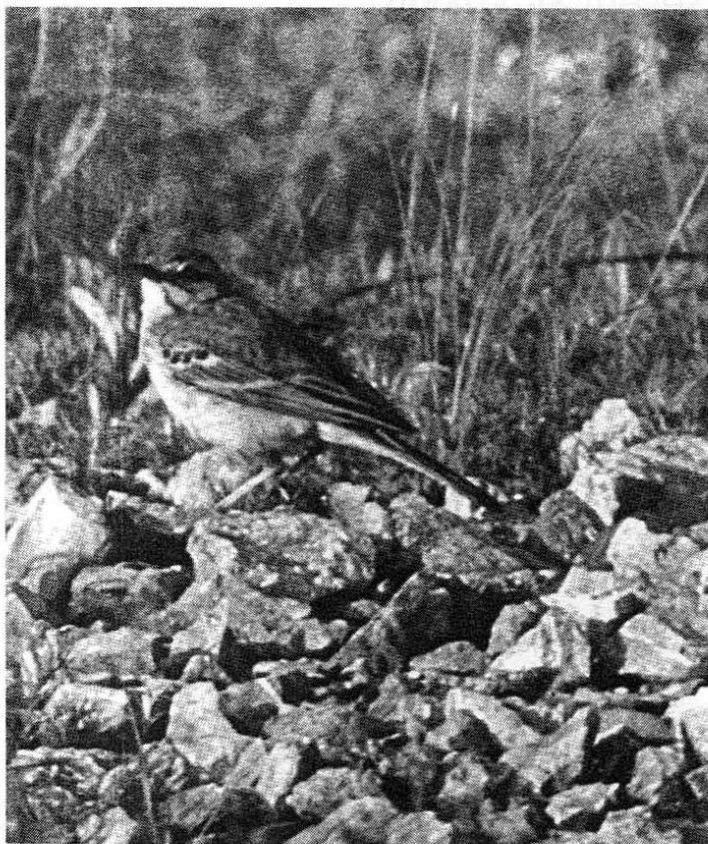
Slika 1, 2: Rjava cipa Anthus campestris , Koritnice 22. 6. 1990.