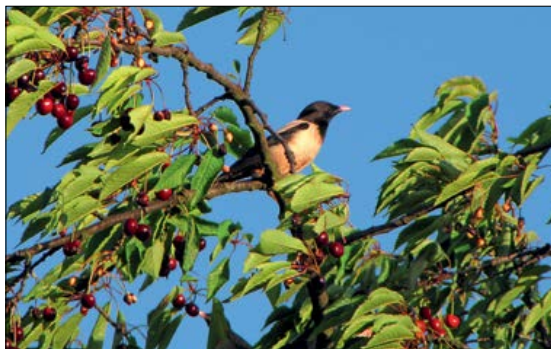
Slike 7–12 / Figures 7–12: (7) ozkohljuni liskonožec Phalaropus lobatus, 28. 8.–31. 8. 2014, Ormoške lagune ; (8 & 9) zalivski galeb Chroicocephalus genei, 24. 8. 2014, zadrževalnik Mjedvedce ; (10) močvirska uharica Asio flammeus, 15. 4. 2014, Gmajnice, Ljubljansko barje ; (11) močvirska uharica, 24. 5. 2014, kanal Grande, Sečoveljske soline ; (12) rožnati škorec Pastor roseus, 24. 5. 2014, Vič, Ljubljana