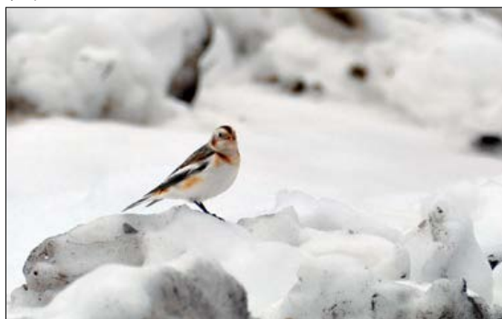
Slike 13–18 / Figures 13–18: (13) citronasta pastirica Motacilla citreola, 19. 4. 2014, Puconci ; (14) citronasta pastirica, 23. 4. 2014, Puconci ; (15) citronasta pastirica, 15. 7. 2014, Gorenje Jezero, Cerkniško jezero ; (16) konopeljščica Carduelis citrinella, 20. 11. 2014, Godovič ; (17) konopeljščica, 20. 11. 2014, Godovič ; (18) snežni strnad Plectrophenax nivalis, 2. 2. 2014, Soča