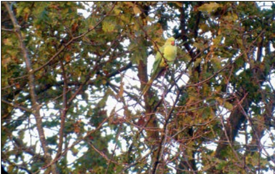
Slike 25–27 / Figures 25–27: (25) španska kotorna Alectoris rufa, 30. 1. 2014, gramoznica Vrbina ; (26) biserna grlica Streptopelia chinensis, 23. 4. 2014, Godovič ; (27) aleksander Psittacula krameri, 26. 10. 2014, Ljubečna