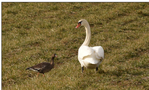
Slike 7–10 / Figures 7–10: (7) ploskokljuni liskonožec Phalaropus fulicarius, 3. 11. 2017, Ptujsko jezero ; (8) rjavoglavi srakoper Lanius senator, 13. 5. 2017, Lesce ; (10–11) mala gos Anser erythropus, 17. 2. 2017, Družmirsko jezero