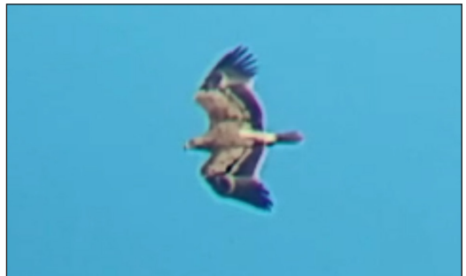
Slike 1–6 / Figures 1–6: (1) belolična gos Branta leucopsis, 12. 1. 2017, Babinci ; (2) belolična gos Branta leucopsis, 14. 1. 2017, Ormoško jezero ; (3) belolična gos Branta leucopsis, 28. 10. 2017, zadrževalnik Medvedce ; (4) črna raca Melanitta nigra, Žovneško jezero, 22. 2. 2017 ; (5) veliki klinkač Clanga clanga, 15. 11. 2017, zadrževalnik Medvedce ; (6) kraljevi orel Aquila heliaca, 12. 3. 2017, Griško polje, Senožeče.